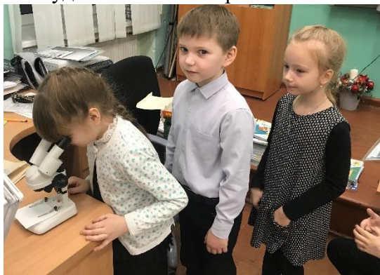
«Откуда в снежинках грязь»