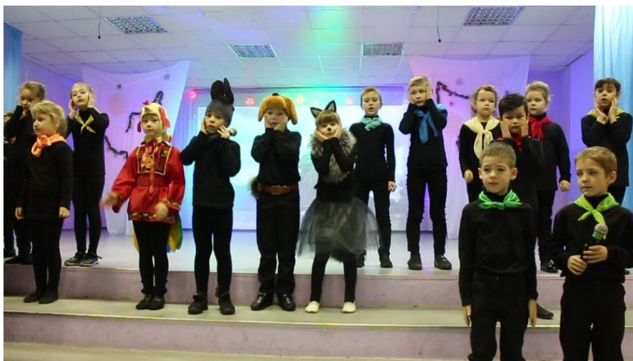
Сейчас мы готовим выступление к 8 марта.