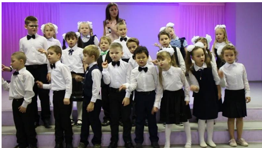
Постановка спектакля к Новому году «Бременские музыканты»