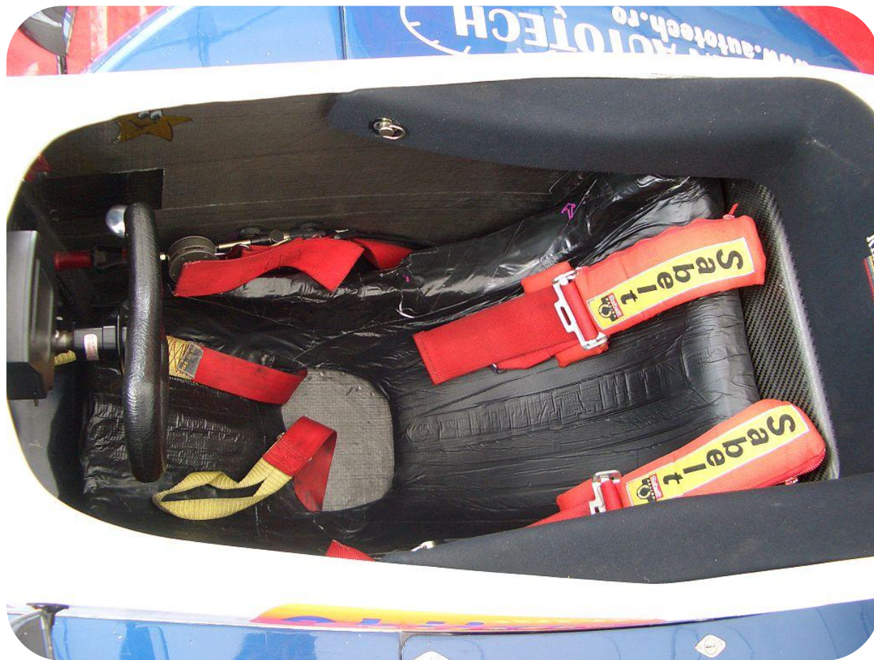
Многоточечные ремни безопасности гоночного автомобиля